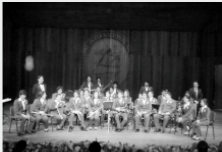
Banda Sinfónica Fundación Colegio UIS

XI Festival 2015 Nacional Sept. Infantil de 7-13 Música Colombiana