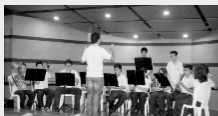
Banda Musical Colegio Agustiniano de Floridablanca