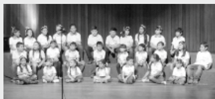
Coro Infantil Fundación Cultural "La Cuerda"