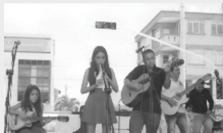
Dueto Hermanas Baena