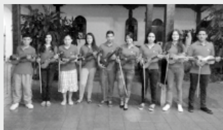
Ensamble de Violines Casa de la Cultura Piedra del Sol (Floridablanca)