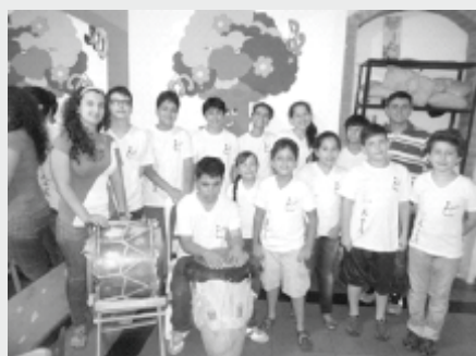
Ensamble Cantar Libre Tocata