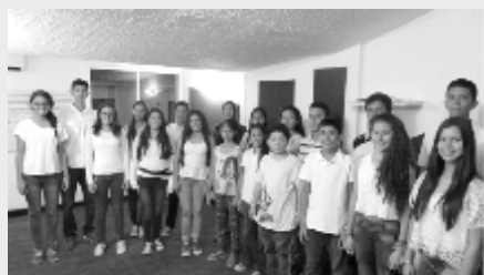
Coro Juvenil Fundación Cultural "La Cuerda"