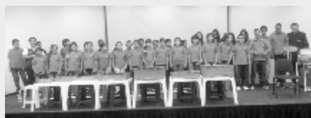
Centro Musical Batuta Bucaramanga