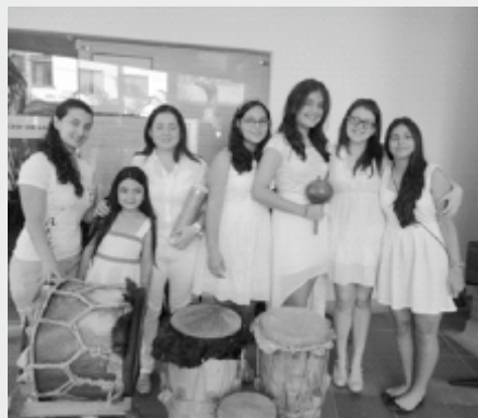
Ensamble Suenla Tambora Tocata

XI Festival 2015 Nacional Sept. Infantil de 7-13 Música Colombiana