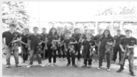
Orquesta de Cámara El Puente

XI Festival 2015 Nacional Sept. Infantil de 7-13 Música Colombiana