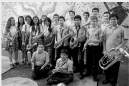
Banda de Vientos del Colegio Jorge Ardila Duarte

Grupo de diversa edad (5 a 14 años) en dónde jóvenes pianista prueban otra forma de tocar haciendo música colombiana desde una visión contemporánea, lo que les ayuda a ver que con estos ritmos, los de nuestra tierra, se puede jugar y crear algo nuevo.