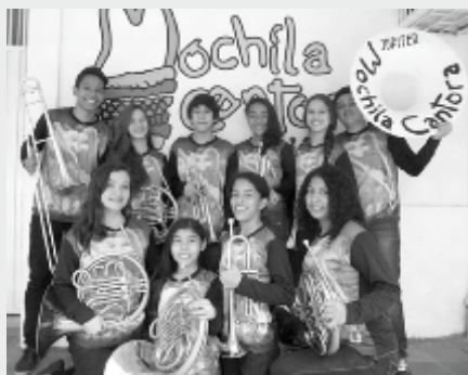
Ensamble de Metales Mochila Cantora

El trabajo de música de cámara estos chicos exploran la brillante sonoridad de sus instrumentos poniéndolos sobre los lindos aires colombianos, enriqueciendo sus posibilidades interpretativas y técnicas.